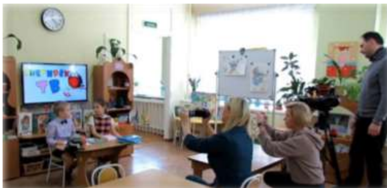
Рис. 4. «Народное телевидение» городов Апатиты, Кировск на съемках выпуска новостей «Снегирёк ТВ»

Родители воспитанников не только активно включились в подготовку детей к выпускам новостей, но и предложили свои идеи на будущее, помогли в организации съемок. В процессе реализации проекта родились еще два, которые уже начали воплощать в стенах нашего ДОО.