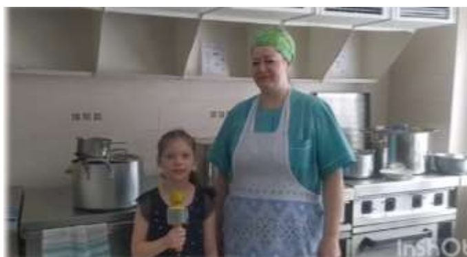
Рис. 3. Интервью повара о любимой книге детства