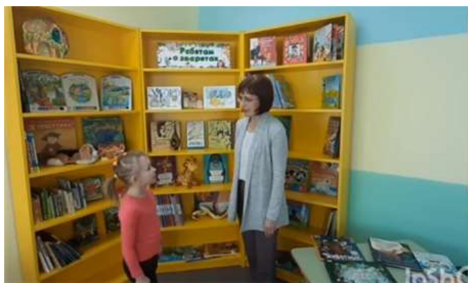
Рис. 1. Интервью в городской детско-юношеской библиотеке

Второй выпуск был посвящен русским народным сказкам, о которых поведала хозяйки Русской избы, а также продемонстрировала видеосрез ОД «Путешествие по сказкам».